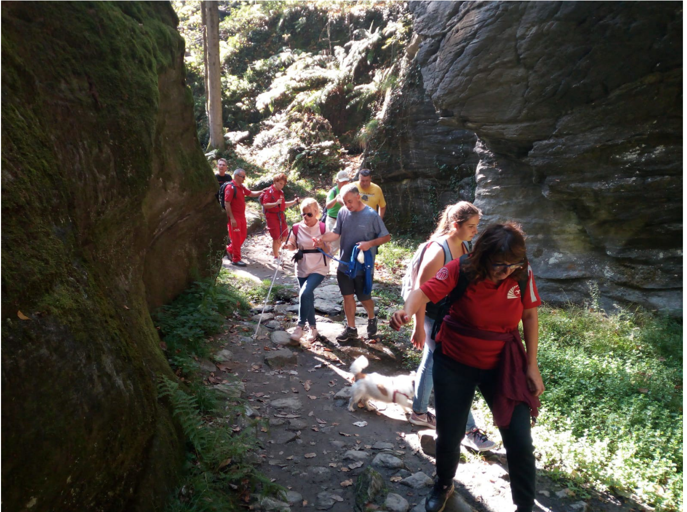
Nella foto passaggio nell'Orrido di Uriezzo